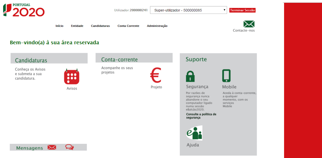
FIGURA 2 PÁGINA INICIAL DA ÁREA RESERVADA – ENTIDADE

Depois da sessão iniciada, será possível aceder à Área Reservada.