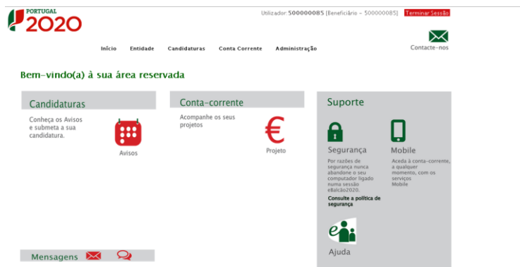
Página inicial da Área Reservada

Entidade Candidaturas Conta Corrente Administração