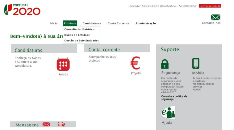
Página inicial da Área Reservada – Entidade

No menu Entidade surgem diversas opções que contemplam a consulta do histórico das ações realizadas pela entidade no Balcão 2020 bem como a consulta e alteração dos dados da entidade.