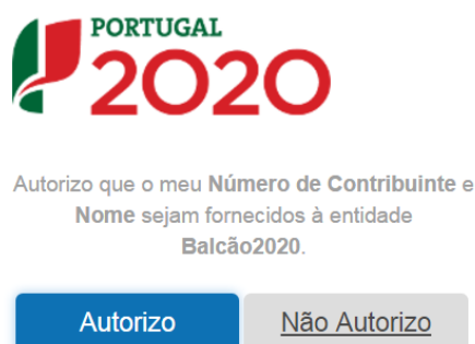
FIGURA 13 SUBMISSÃO DE REPORTE DE EXECUÇÃO FÍSICA – AUTENTICAÇÃO AT

Deverá clicar no botão Autorizo para permitir a consulta dos dados ao Balcão 2020.