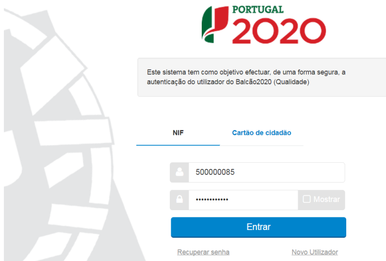
FIGURA 12 SUBMISSÃO DE REPORTE DE EXECUÇÃO – AUTENTICAÇÃO AT

Deverá clicar no botão Autorizo para permitir a consulta dos dados ao Balcão 2020.