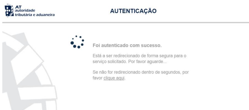
FIGURA 14 SUBMISSÃO DE REPORTE DE EXECUÇÃO FÍSICA – AUTENTICAÇÃO AT

Deverá aguardar uns instantes pela Autenticação do Contribuinte.